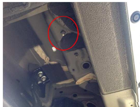
取付参考写真1 取付ステップ型式: ASE1500-170